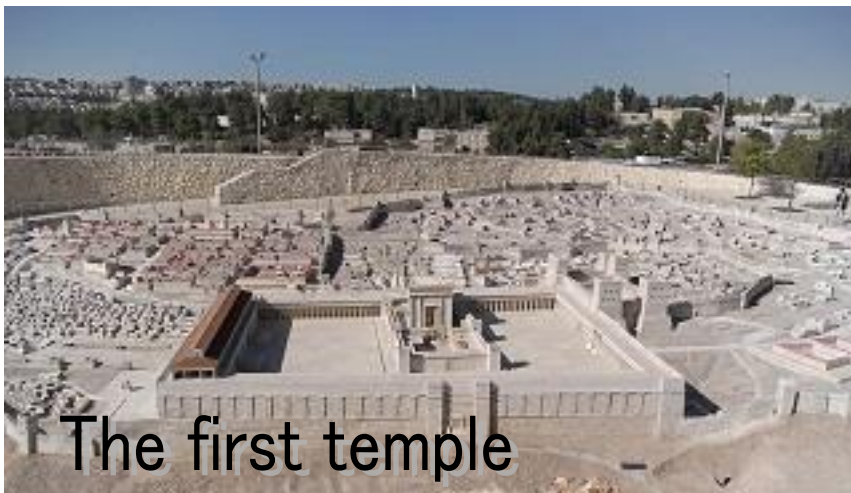
The first temple

Hittites, Egypt and Assyria were weak and lost their power at that time.