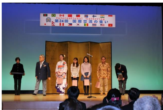
引き続いて 34 回英語スピーチ優勝者による英語スピーチ