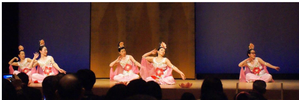
中国の優美な伝統舞踊