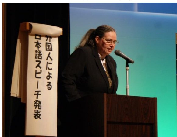
ウェンデイ先生の司会で日本語スピーチ